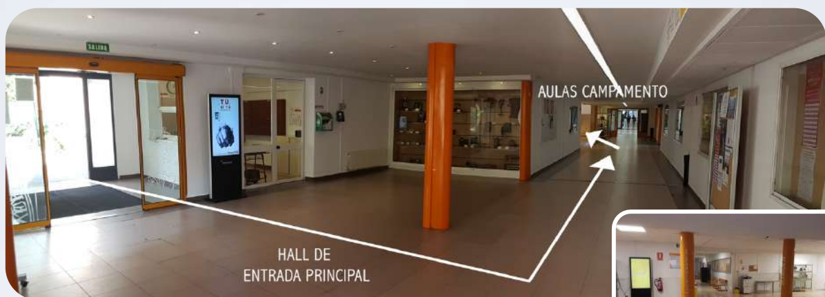
Hall de entrada y camino para llegar a las aulas asignadas